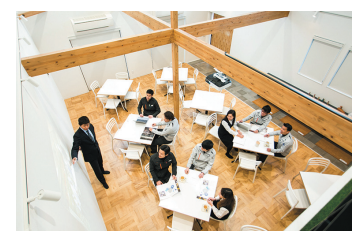
創造するワイガヤスペース

少数精鋭で生産性を向上する手法として『健康経営』を意識し、ワイガヤスペースや福利厚生施設の充実により経営的視点から取り組む働き方改革を実施。顧客への提案型事業等においても活発に共創できるオフィスを整備することで、クリエイティブな発想とイノベーションの創出を実現しており、「仕事をするための人員確保」ではなく、「仕事を創り出すための人員確保」を行い、地域雇用にも大きく貢献している。