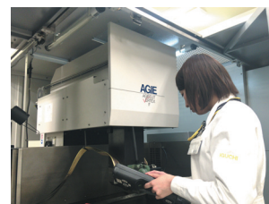
工作機械を操作する女性社員

男女、文系・理系、経験の有無を問わない採用戦略を実施している。社員は、現場で基本を教わった後、自主的、自発的に学ぶ。失敗しながらも新たな加工に挑戦し続ける事でイノベーションに繋がっている。給与体系、昇進制度は年功序列ではなく、3年目の若手管理職や創業当時パートだった主婦が、現在は二人の子供を持つ執行役員として活躍。部長職以上の女性管理職比率は7割を超える。女性トイレの内装、セキュリティ、室内空調温度等女性の働きやすい職場作りに取り組んでいる。