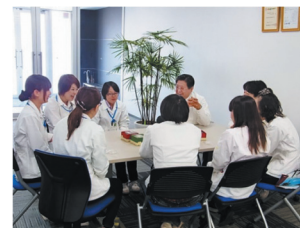
井口社長と女性社員の座談会の様子

職人、理系、男性社会であった製造業で、新たなビジネスモデル構築のイノベーションを起こすには多分野、多人種（男女・文理問わず）の人材採用が重要な位置づけであると考えた。他分野人材による新たな加工領域への挑戦、データを安定的に溜める女性の緻密さ、それを支えるICT技術を社長自らが担う事により、長期的に経営力向上を図ることが可能な人材戦略の基礎を築いた。新たな構想を社長自ら打ちたて、社員それぞれの特性・アイデアで、新規ビジネスモデルを作り上げている。