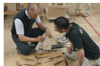
社長自らが従業員に技術を教える風景

従業員に家具製作技能士の資格取得を促進。昇給制度を充実させ、休日の工場を開放した自主訓練の場を設けることにより、社員の技能が向上し、取得率は90%を超える。また、技能を習得した従業員が独立しやすい社風を醸成することにより、1979年の創業以降、約40名が独立。全国各地で活躍する職人とのネットワークを活用し、各地の消費者ニーズ等を情報収集するとともに、大型受注を分担するなど、同社の重要な経営資源となっている。さらに、女性の採用も積極的に行っており、従業員42名のうち10名を女性が占め、デザインや繊細な家具作りに貢献。