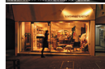
IFDAの様子(上)と都内専門店の外観(下)