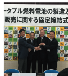
美郷町協定締結式

2018年には自社製品である「緊急災害時向けポータブル水素発電機」の開発、販売を行う計画があり、その実現に向け、宮崎県美郷町と連携し、廃校及び廃工場を活用した組立工場も新設（同町では約40年振りの企業立地）を予定する等、地域貢献にも大きく寄与している。計3～6名の新卒・中途採用を毎年行っており、2017年には営業所開設のためプロフェッショナル人材活用制度を宮崎県で初めて利用し、大手企業出身者を営業所長として採用する等積極的に雇用を創出している。