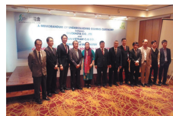
ベトナム現地企業と販売店契約調印式

JICA 中小企業海外展開支援事業「普及・実証事業」を通じ、ベトナムにおいて「BUIKシステム」による有機廃棄物のコンポスト事業を実施。独自の「内城菌」を利用して現地で排出される生ごみを8時間で高速発酵分解することができ、生成された二次製品は付加価値の高い肥料や飼料添加物として土壌や池の再生に活用できることが実証された。その成果を契機として、2017年に現地ベトナム国営企業と販売店契約を締結。現在、ベトナムで本格的なビジネスが展開されている。