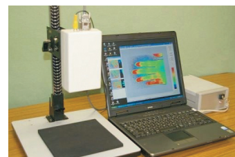
皮膚血流画像化装置 LSFG-ANW

九州工業大学藤居研究室で数十年に渡って研究されてきた血流画像化技術（レーザースペックルフローグラフィー：LSFG）を基に、大学発ベンチャー企業として、血流画像化装置を開発・製品化。眼底血流画像化装置（LSFG-NAVI）は、30以上の医療施設に導入されている。また、皮膚血流画像化装置（LSFG-PFI）は、糖尿病や動脈硬化による下肢虚血症の診断や治療効果の確認に利用され始めている。LSFG技術を通じて視力や歩行能力の維持など健康寿命の延伸に寄与している。