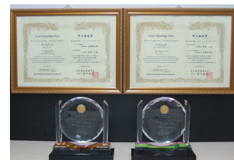
「第42回井上春成賞」を受賞