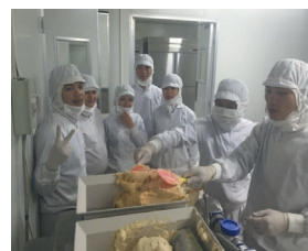
ベトナム人スタッフ

ベトナムに合併会社を設立していることから、相互にマネジメントクラスで活躍できる人材を育てるために、現在30名ほどのベトナム人留学生を採用している。中国への早期進出を見据え、中国人社員の採用も行い、能力や目指すキャリアに応じて本人の将来設計にも資する人材育成を図っている。また、日本語学校の留学生への就労支援を行っており、毎年20名ほどの新規留学生を採用。インバウンド対応と日本食文化の海外普及に貢献しつつ、工夫を凝らした働き方で競争性を確保している。