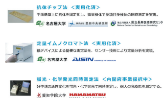
大手企業との共同開発検査システム

大豆の健康効果の個人差に着目した『ソイチェック』や腸内環境をみる『腸活チェック』など、身近な食生活に関する検査を実現。30代～50代の女性を中心に累計ユーザー数は15万人を超え、全国の医療機関650施設、調剤薬局約2,000店舗で展開。大手通販サイトでは『ソイチェック』が検査キット部門で1位を常時獲得。健保組合や自治体でも健康意識向上等のため活用が進んでいる。