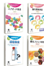
郵送検査サービス「カラダチェック」の各商品

同社は検査サービスを通じて、医療機関で保有しない未病段階の顧客情報や生活習慣に関するデータを取得。顧客からデータの二次利用の同意を得て、研究用途、情報提供へ活用している。検査結果と生活習慣や行動特性を解析し、各ユーザーに生活習慣改善提案サービスを進めている。