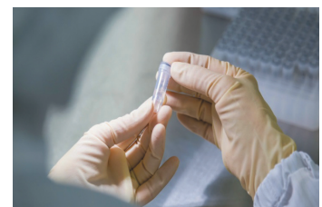
医療産業分野への進出

静岡県は県主導で医療健康産業クラスター「ファルマバレープロジェクト」を推進しており、地元医薬品メーカーも多いことから、当地の産業集積を活用し、高品質な製品供給を実現、地域経済活性化に大きく貢献している。