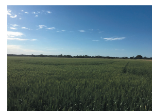
豪州国内契約有機小麦農場

こうした取組が評価され、2016年にメルボルンで開かれた日豪経済合同委員会会議では社長がプレゼンを行い、出席者に感銘を与えた。