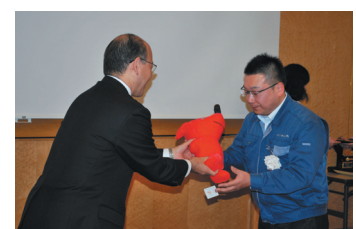
新社長への事業承継と新事業参入

従前より父親である代表取締役から事業承継の打診を受けてきた専務（現代表取締役）は縮小傾向の部品市場と下請受注中心の事業環境に危機感を抱き、医療機器製品市場参入に向けた事業計画を策定し、2014年の就任とともに本格化させた。