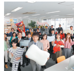
社内の従業員一同