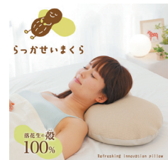
落花生の殻を利用した「らっかせいまくら」

地域資源を活用した「落花生殻まくらプロジェクト」を実施し、これまで廃棄されていた落花生の殻をまくらに活用することで無駄を出さない資源の有効活用を実現。また、最近では九十九里の塩を使ったまくらを商品化するなど、ご当地まくらシリーズを展開。県内唯一の地域資源活用事業計画認定を受け、商品化された「らっかせいまくら」の初回製造分は完売するなど高い評価を得ている。