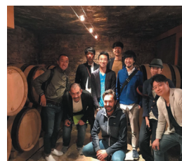
仏での販路開拓 （水戸部社長は一番右）

シンガポール、韓国、香港、カナダ向けに展開しており、フランス、米国、タイへの輸出も開始。フランスでは、ブルゴーニュのトップ醸造家と繋がり深いクルティエ（ワイン仲介人）と組んで、最高級レストランや世界の富裕層をターゲットとして日本酒を売り込んでいる。嗜好品の文化において、世界の中心であるフランスで価値を認められることにより、他の地域へ波及させる。こうした取組を日本各地の銘醸蔵と共同で行い自蔵のみならず、世界の中で日本酒全体の価値を高めることが目標。なお、平成29年度ジャパンプランド事業（補助金）で香港を中心に海外販路開拓を進める。