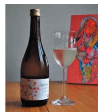
マロラクティック発酵「まろら」

マロラクティック発酵（MLF）とは、ワイン醸造時に用いられる乳酸発酵の技術で、強い酸味のリンゴ酸を穏やかな酸味の乳酸に分解することで、ワインの味をまろやかにする技術。繊細な温度制御等が求められるが、山形県工業技術センターと連携し、従来の職人と気候に任せた醸造から、醸造条件の数値化やものづくり補助金を活用した醸造設備の導入等で、「まろら」の開発に成功した。