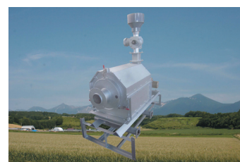
バイオマス燃焼用 温風式熱供給装置

これまでのバイオマスバーナでは燃焼が難しかったが、独自の回転炉燃焼技術を開発し、農業廃棄物系燃料の利用に活路を拓いた。農業用ハウスへの温風供給などエネルギーの地産地消を可能にした。