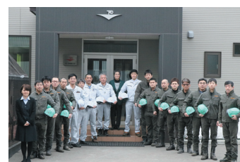
少数精鋭の技術集団

将来の発展を図るため、環境・エネルギー分野の新規事業を担う人材を登用した。これまでの一般産業機械の製作、整備、修繕工事等、比較的受け身の事業に対し、新たに付加価値を生み出す創造的な事業を加えることで、ものづくりの現場は相互に刺激し合い活力を生み出している。新事業の展開により連携が促進され研究機関等との人材交流が生まれ、労働集約的な事業から資本集約、知的集約的事業への転換を図っている。