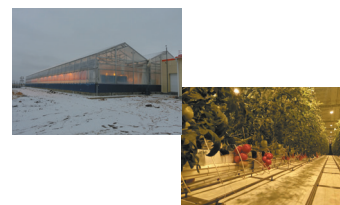
ロシア・ヤクーツクの温室施設（日中の様子）とトマト

永久凍土のロシア・ヤクーツクは気温がマイナス 50℃以下になる極寒の地であり、冬の野菜供給は中国などの輸入品に頼るしかなく、安心・安全なトマトを現地栽培してほしいという現地政府からの要請で、北海道で培った温室栽培技術による「通年型温室プロジェクト」を提案。経験したことのない寒さと僅かな日射量、永久凍土での工事や栽培指導、流通網の構築など多くの困難を克服し、トマト栽培・販売に成功。