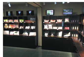
アンテナショップ「まんぶく猫」（ロシア・ウラジオストク）

物流ルートやコストの調査、現地でのマーケティングなど地域中小企業のロシアでのビジネス展開をトータルで支援。地域・企業に密着した輸出支援を進め、着実な北海道ブランド確立に繋がっている。