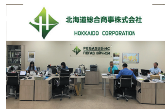
企業ロゴと現地法人「ベガスHC」のオフィス

北海道内の様々な地域に眠る価値の高い商品を掘り起こし、海外における市場開拓から金融・決裁、物流までトータルでサポートする。