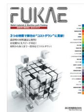
VA/VE 提案用製品カタログ

取引先（中小加工業者）との具体的な改善事例を収集した VA/VE 提案を含む製品カタログを作成。カタログをベースに、VA/VE セミナーや Web での販売促進活動を通じて、設計段階から顧客を巻き込みニーズを収集。この活動を通して、営業が取引先の営業代行機能を持つ新たな営業体制を確立。また同社は環境に配慮した新鋼種の開発にも成功。これらの活動により、取引先と顧客をつなぐ製造業のベストパートナーとして「ものづくり商社」スタイルを確立。