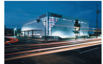
24 時間無人稼働の FA センター

国内外の鉄鋼及び特殊鋼メーカーから特殊鋼やステンレス鋼のほかアルミニウムなど多種多様な鋼材、金属材料を調達。同社で切断～マシニングまでの一貫の加工設備を備えるほか、技術力ある顧客企業との連携体制を構築し、短納期・高品質・コスト低減を実現。同社で手がける鋼材は、自動車・建機・航空機・IT 機器などの部品のほか、建材・金型・工具など様々な部材の材料として活用されている。