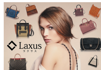
ブランドバッグシェアリング「ラクサス」

2006年設立のベンチャー企業。同社開発の英会話教材の販売で2009年から7年連続売上日本一を達成。現在はオシャレを自由に楽しみたいという世界中のファッションистの潜在的課題を解決するため、ブランドバッグが無制限に使い放題という革新的なシェアリングサービス「ラクサス」の展開。2016年10月には、シェアリングサービスにおいて認知・利用率ともに、世界的サービスのAirbnb、Uberに続き第3位を獲得。