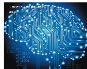
2種類のA.I. (人工知能)を活用

同社サービス「ラクサス」にAIを実装することで、顧客に最適なバッグをレコメンドすることができる。このレコメンドシステムにより圧倒的業界No.1の在庫数12,000種類あるバッグからでも、顧客は悩むことなく気に入ったバッグを選ぶことができる。また、IT技術の活用により、スマートフォンでの面倒な入力を簡略化。一般的な住所入力では平均100~200タップ必要なところ、同社アプリでの情報登録は写真を2枚撮影するだけ、わずか10秒で完了する。