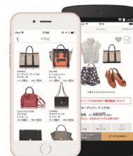
スマートフォンから簡単にバッグを予約

2015年2月にAIを活用したファッションシェアリング「Laxus (ラクサス)」をローンチ。月々6,800円で12,000種類を超えるブランドバッグが無制限に使い放題のサービスであり、高額なバッグにまでは手が回らないという女性の悩みを解決。アプリローンチ1年8か月で20万ダウンロードを突破。継続率は全体で90%を超えている。また、10ヶ月以上継続している顧客の継続率は95%を超えており顧客のニーズをつかんだ満足度の高いサービスである。