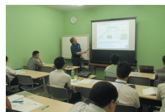
座学コースの様子

世界に熱処理エンジニアを輩出していきたいという思いから、「初心者でも分かりやすい」「熱処理の現場体験型」の金属熱処理の専門学校、「金属熱処理スクール」を設立した。他社・関連業種の金属熱処理を学びたい方へ、レベルに応じた教育カリキュラムを用意。実際の熱処理現場のプロによる現場経験を活かした少人数制のきめ細やかな指導を行ない、夜間や土曜日も開講している外、出張講習も実施している。愛知県職業能力開発協会・安城商工会議所の後援も受けている。