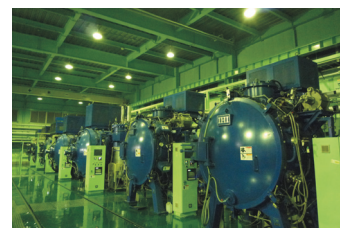
全20基の多彩な設備群

真空熱処理を主体とした日本最大級の真空熱処理工場。広範囲な鋼種、様々な部品の焼入れ、焼鈍、特殊処理に対し多彩な設備群と独自技術で難加工に対応。処理後の製品の「精度と品質」を重要視し、製品の材質や形状、数量に応じて20基の真空炉の中から最適な処理炉を選択した上で、配置・風量の調節により昇温温度・保持時間などのパラメーターを最適化しムラの無い処理を行っている。これにより歪の低減、後加工の軽減につながりコストダウンを実現している。