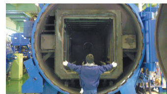
国内最大級の超大型真空熱処理炉

1973年の会社設立、真空熱処理を柱とする金属熱処理メーカー。国内最大級の設備を含む多彩な設備群と独自技術で難加工に対応。金型の長寿命化を実現するRVC処理や、ネオジム磁石処理などオンリーワン、シェアトップの技術を有する。3Kを3C(クリーン・コンフォータブル・クリエイティブ)に変え世界一綺麗な熱処理工場をめざしており、「展望式工場見学ルーム」を設置している。