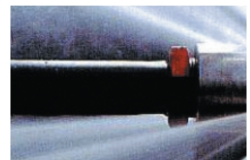
ウォータージェットの切れ味

厚さ40mmの鉄板も切れるという刃物以上の切れ味と粉塵を発生させない環境性能を併せ持つウォータージェット「鋼の水」を活用し、様々な現場で活躍中。近年では、プラントメンテナンスに留まらず、発電所メンテナンスやトンネル補強工事など新分野への進出も果たすなど、ウォータージェット工法のリーディングカンパニーとして他社の追随を許さず、常に革新・付加価値向上に努めている。