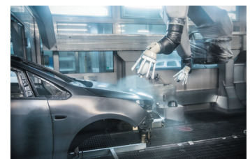
顧客の多様なニーズに対応

主要顧客の工場に当社技術者を常駐・パトロールさせ、工場内のどこをメンテナンスすべきか、提案型営業を実施。顧客以上に工場内部を知り尽くした技術者もいるほどであり、顧客からは絶大な信頼を獲得。また、顧客とともに現場特性に合わせた専用装置の開発を行っており、顧客の多様なニーズに的確に対応。これら取組により、取引先の企業様との良好な関係を構築している。