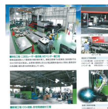
多品種、小ロットにも安定した品質でスピード供給

建築技能労働者の退職や施工現場の大変な重労働に起因して今後、施工現場の作業者が大幅に減少することが懸念されている。当社はこの改善策として施工現場の安全作業の確保と誰が施工しても同じ品質が保たれる製品の研究や作業員の省人化の実現のための製品を開発している。特に、施工現場において脚立に乗っての作業中に転倒する事故も多く発生しており、当社の開発品によって脚立に乗っての作業が廃止となった製品をたくさん市場に供給をしている。