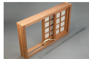
敷居レベル調整材

2008年より社員全員の参加による、様々な部門・工程で生産性向上やコスト削減の提案活動を実施している。この活動を通じて、社員全員にコスト意識を浸透させ、常に生産性の向上を図っている。年間の提案件数は毎年700件以上となり、改善効果金額も数百万円と大きな効果を出している。また、改善の視点が根付いたことにより、顧客も施工現場での工程短縮に役立つ新たな開発製品など高付加価値製品が次々と提案され開発されている。