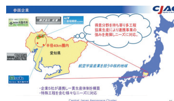
一貫生産体制における企業連携

また、特定企業のための製造だけでなく、国内他社メーカーや海外エンジンメーカーからの直接受注も視野に入れ、強い国内企業へと進化するビジネスプランを策定している。