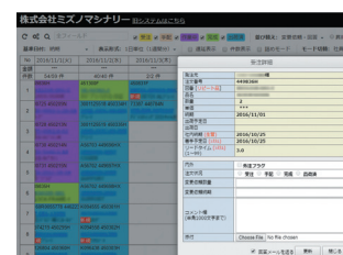
顧客もネット閲覧できる「見える化」システム

また、熟練社員の知識をデジタル化し、条件等のインプットだけで加工プログラムに反映できる高精度なシステムを構築。納期は競合他社の半分以上に短縮することを実現している。