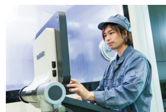
航空宇宙関連部品向け新工場 ドイツ製工作機械を操る技術者

また、ISO9001、ISO14001 及び JISQ9100 を取得し、品質管理体制も整えている。