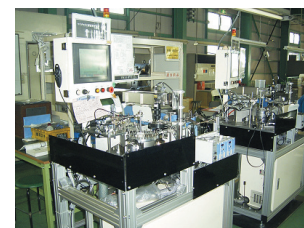
こだわりの品質保証機器

年々厳しくなる大手企業の品質要求をクリアし、技術力が大幅に向上している海外企業に立ち向かうため、出荷製品への不良品・異品混入を徹底的にゼロにする取組を進めている。その一環として、製品の画像選別機を開発業者と協力し開発、出荷製品に不良品が混入することを食い止めている。また、現場の5Sの徹底のほか、高額な費用はかかるものの精密測定器や製造機器へのセンサー導入を強化することで、不良品そのものを発生させないものづくりを推進している。