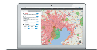
ドローン飛行支援地図サービス SORAPASS

ドローンはその利用機会が急拡大する一方で運用面での課題が顕在化。同社が展開するWEBサービス「SORAPASS」は、改正航空法対応（人口集中地区・空港周辺の確認や許可申請書作成）を一元的にサポートするもので、コンサルティング業務のみならず、ドローンユーザーの煩雑な事務効率を大幅に改善するもの。また、安全な飛行技術等の普及・習得を目指した業界団体「(一社)日本UAS産業振興協議会」の設立・運営を担い、ドローン操縦士育成を全国展開するなど、社会全体で効率的にドローンが利活用出来る環境整備で業界をリードする。