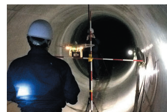
下水管点検のイメージ

また、ドローンの社会実装において大きな課題であった非GPS環境下での自動飛行技術を産学連携による技術開発により実現。同社システムの競争力を強化すると共に、社会的にも屋内、橋梁下、配管内など幅広い分野でのドローン活用に道筋をつける技術として期待されている。