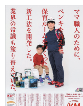
新聞に掲載した広告

また、業界トップクラスの引退間際のシニアを指導者として再雇用したところ、生き生きと活躍している。