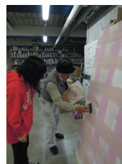
インストラクターによる技術指導

多様な人材に対する職人育成プログラムの活用によって、多くの人材の育成が可能となった。さらに業界トップクラスの技能を持つ職人だけでなく、塗料メーカーや業界の訓練施設などと連携して高度な技術指導を行うことで、優れた技術が確実に承継されている。