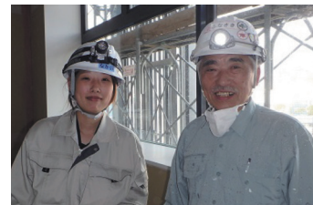
ダイバーシティ経営の成果

建設業界の縦割りの考えに固執した従来型の建設専門工事会社ではなく、類を見ない人材育成システム“めっちゃプロフェッショナル”により、スタート事業の建築塗装業のみならず、今や左官工事、耐火被覆工事、防水工事等の新たなマーケットを次々に事業拡大している創立 4 年の企業である。