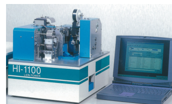
Semi-Auto Wire Processor HI-1100 System

同社製品の制御盤用電線加工機はクラウドと繋ぐことで、顧客が1本の電線を加工するたびに、使用対価を徴収する方式に転換。これにより同加工機の販売価格の大幅な低減を実現しており、従来は大手企業しかできなかったイニシャルを抑えて、ランニングで儲けるビジネスモデルを中小企業で実現する（2017年4月からスタート）。