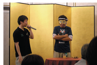
新技术や生産性改善取組発表

社長は家業を継ぐまで、Jリーグの湘南ベルマーレでコーチを務めており、人材育成の手腕は高く評価されていた。現在も、サッカークラブチーム「LionPower小松」の代表・監督を務め、小松市を拠点にJリーグ入りを目指している。こうした経験を活かし、人材育成においても自ら課題を設定し、考え、解決できる社員の教育を実践。各部署の新技术や生産性改善などの取組を発表し、全従業員の投票で優勝を決める。発表には「笑い」も求め、半分遊びで楽しむことで、継続的な技術力向上に繋げている。