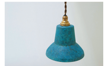
tone ブランドのペンダントライト

また、デザイナー等とコラボしたブランド「tone」を立ち上げ、単なる着色受託企業から、企画段階からモノを創り販売する「モノづくり企業」への転換を図っている。2015年「tone」シリーズ、The Wonder 500 認定を受ける。