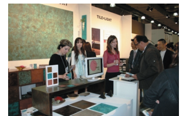
ニューヨーク国際現代家具見本市

インテリアライフスタイルリビング (IFFT)、ニューヨーク国際現代家具見本市 (ICFF) などの世界中のバイヤーが集う展示会へ継続的に出展し、市場ニーズを把握するとともに、バイヤーとの関係強化を図っている。また、マテリアルコネクション社 (アメリカ) を介して、世界10ヵ国で着色素材を展示するなど、積極的なPRにも努めている。その他、台湾見本市、台湾デザインエキスポ、アンビエンテ国際消費財見本市に出展するなど、新たな海外販路開拓にも注力している。