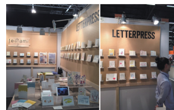
「メゾン・エ・オブジェ」出店風景

2015年には欧州市場に進出し、「メゾン・エ・オブジェ」に出展。また、アジア向けには、台湾のカルチャー発信源として世界的に有名な「誠品書店」にて特設販売を実施。日本独特のセンスが支持を得て、継続販売に繋がり、韓国やアジアでも商談が進んでいる。