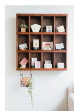
若手デザイナーによる作品

また、海外展開する同社ブランドの商品デザインを、全国の若手デザイナーやイラストレーターに依頼し、国際的にデザインを発表する機会を提供するなど、才能があり、将来有望な若手人材の育成、登用を積極的に進めている。