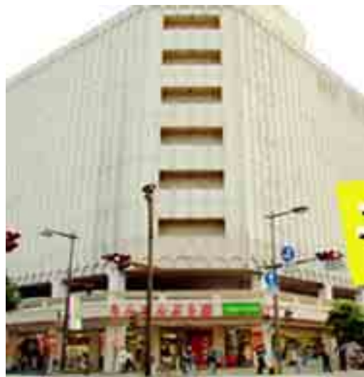
もんぜんぷら座（旧大手スーパービル）

緊急性のある地域、事業を優先し、活性化へ行政・TMOが協働。活性化計画事業の具現化に行政・TMOが動けば民間が動く。