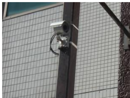
防犯カメラ等による防犯対策