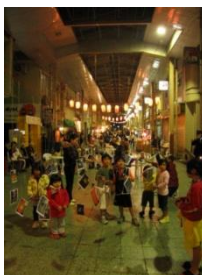
銀天街まつり （沖縄県沖縄市）