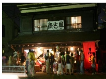
五日市ヨルイチ（東京都あきるの市）