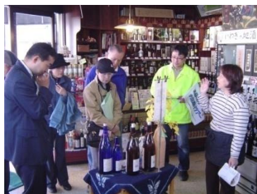
逸品発見！お店回りツアー （福島県いわき市）