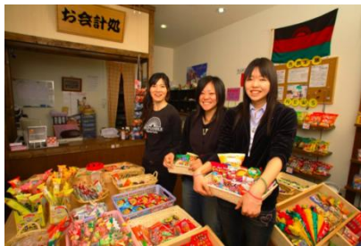
チャレンジショップ・吉商本舗（静岡県富士市）