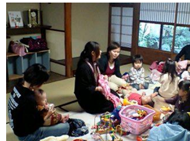
子育てステーション・ばおばおの家 （京都府京都市）