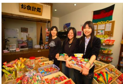
チャレンジショップ・吉商本舗（静岡県富士市）