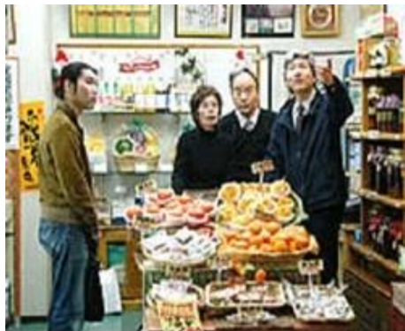
店舗における指導・助言の様子