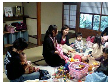
子育てステーション・ばおばおの家 （京都府京都市）