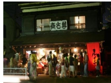
五日市ヨルイチ（東京都あきるの市）