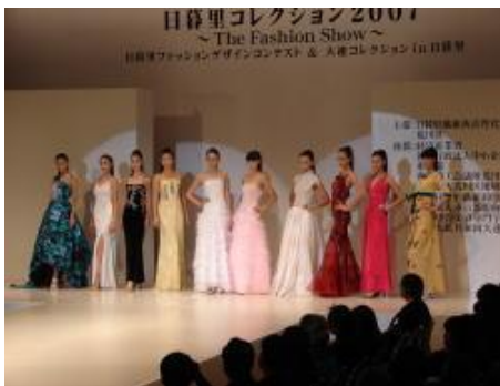
問屋街でのイベントの様子