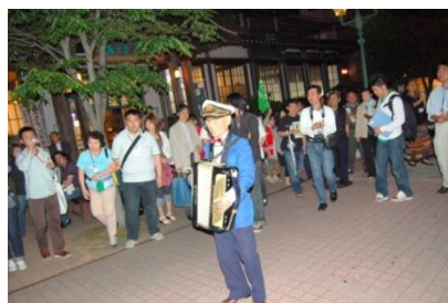
夜の竹瓦路地裏散策（大分県別府市）