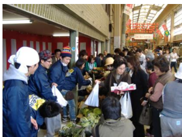
学生による青空市（奈良県天理市）