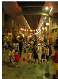
銀天街まつり （沖縄県沖縄市）