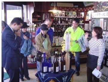
逸品発見！お店回りツアー （福島県いわき市）