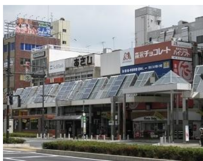
ソーラーパネル付アーケード

（注）このほか、中心市街地活性化法の内閣総理大臣認定を受けた地区における商業活性化事業を支援する「戦略的中心市街地商業等活性化補助金」もあります。