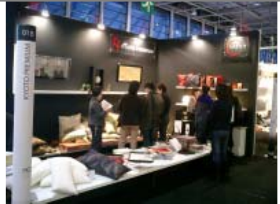
メゾン・エ・オブジェ出展 (1/26~30 フランス・パリ)