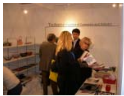
New York 国際ギフトフェア(1/28～2/1)