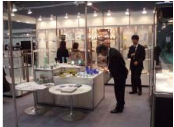
東京テーブルウェアトレードショー2007 1/16～18 幕張メッセ