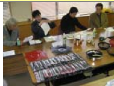
第4回“enn”ブランド育成委員会

アメリカニューヨークの国際ギフトフェアに出展。商談84件、成約・成約見込み21件、代理店の申込み1件。さらに地元月刊誌からの取材があったほか、博物館からのオファーも。総じて、アメリカでも十分通用するとの印象を得た。