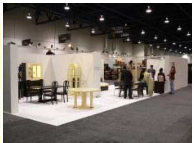
ラスベガスマーケット展示会出展(1/30～2/2 キャッシュマンセンター)