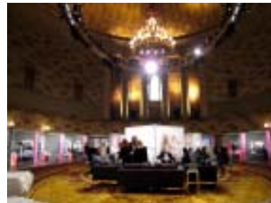
アメリカ市場調査