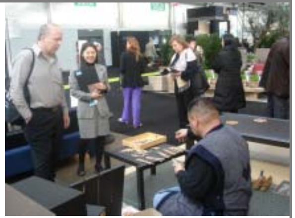
プラネット・ムーブル・パリ出展 (1/25 ~ 29 フランス・パリ)

また、商品の反応としてはおおむね好評であり、特に技術面での関心は高かったが、外国人の日本趣味の域を出ていないような感じでもあった。