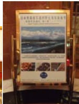
中国・大連での展示商談会