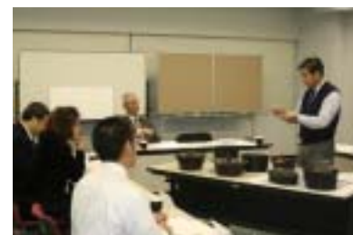
プロジェクト委員会(12/20)

展示会の小間レイアウト(基本レイアウトを決定。細部は次回委員会にて協議)、試作デザインに関するハンドル・摘み部の検証(1アイテムを除き決定)、「コンセプトを考える」をテーマに開催した。