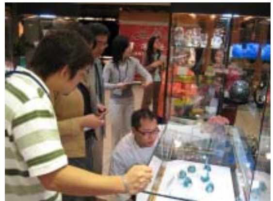
小樽ガラス展 12/1～7 (台湾 太平洋そごう台北忠孝館)

また、みずほコーポレート銀行台北支店を訪問し、台湾の経済状況について調査を行った。データについては現在分析中。