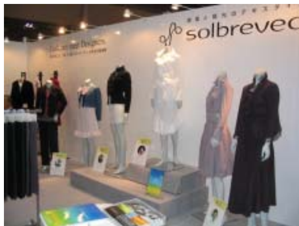
JAPAN CREATION 2007 A/W (12/6~8 東京ビッグサイト)