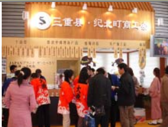
第14回 FHC CHINA 2006 上海 (11/30～12/2 上海新国際博覧中心)