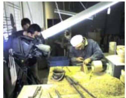
政府広報 TV「ニッポン Navi」 撮影風景(12/12)