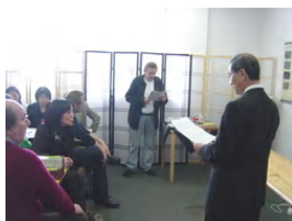
<< マインツセミナー >>