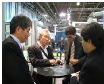
Glasstec 企業ブース訪問 (MDI Schot 社)