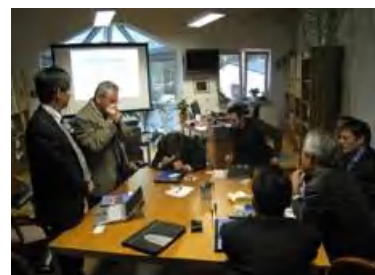
企業訪問 GESAU-WERKZEUGE 社)