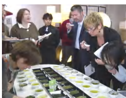
<<ブリュッセルセミナー>>