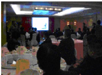
中国上海市 展示・商談会開催風景

12月14日(金)午後2時より東通村庁舎4階会議室に於いて、第2回プロジェクト実行委員会を開催した。実行委員会では、中間でのプロジェクト専門部会の経過報告と中国香港での市場調査や上海市での展示・商談会の状況などの報告を担当のアドバイザー委員が説明した。また、事務局から第3回の実行委員会(報告会)まで含めた、今後のスケジュールについて説明した。