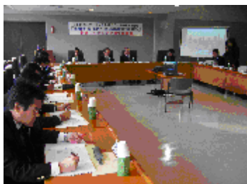
第2回プロジェクト実行委員会開催風景