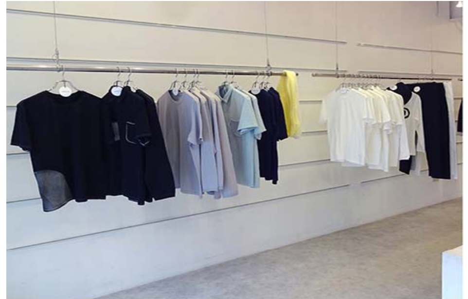
和歌山ニット製品

そのような中で、本市のニット企業では、繊維関連企業が集積する和歌山市の地域性を利用し、糸の選定から染色、編み、縫製、後加工までの全工程を オール和歌山の企業で構築した製品製造を計画 する動きも始まっています。