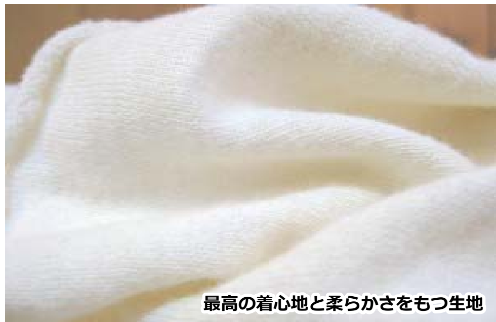
最高の着心地と柔らかさをもつ生地