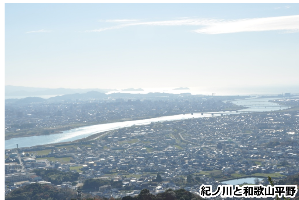
紀ノ川と和歌山平野