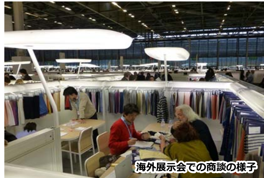
海外展示会での商談の様子