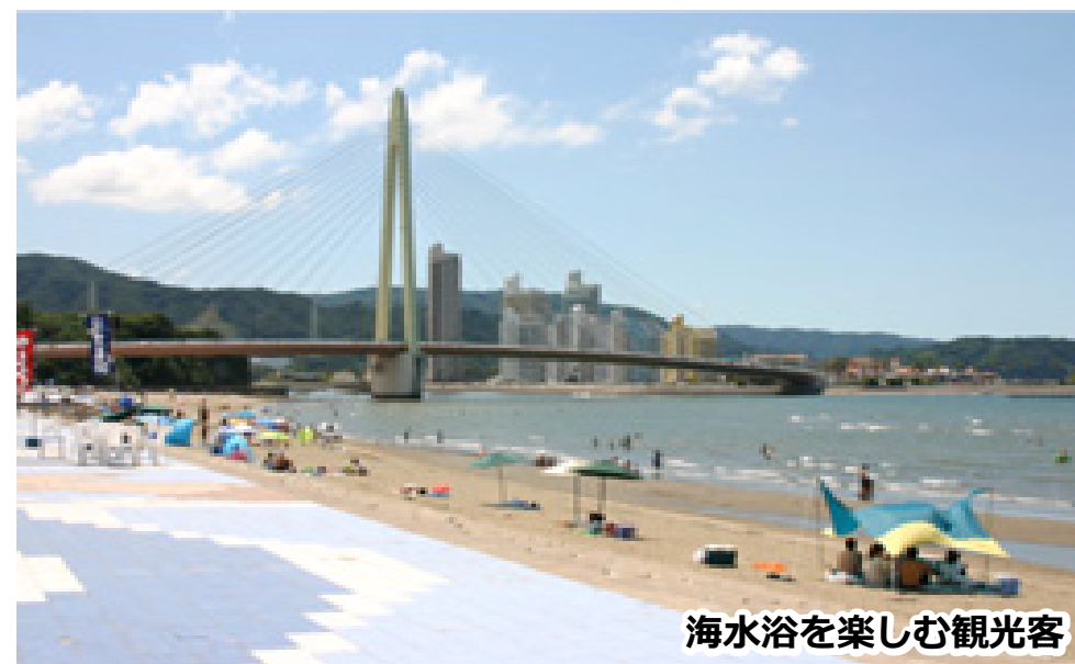
海水浴を楽しむ観光客