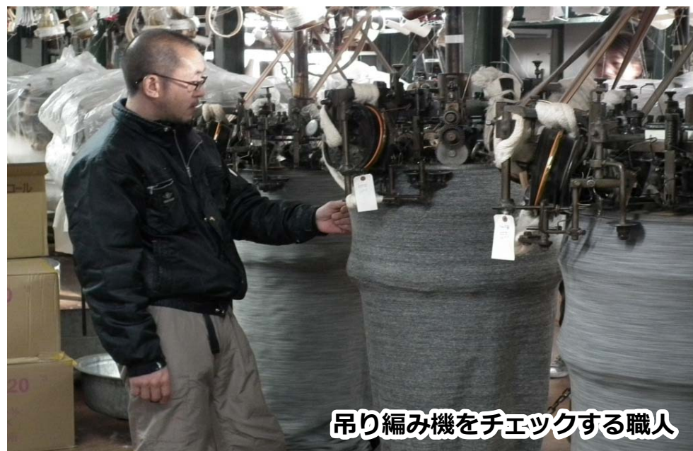
吊り編み機をチェックする職人

このようにして丁寧に作られたニット生地は、 全国屈指の柔らかさと肌触りを誇ります。 また、長年使用しても 生地が傷まない丈夫さも兼ね備えています。 使い込みによって生まれる、 ビンテージ感を楽しめるのも和歌山市のニット生地の特長です。