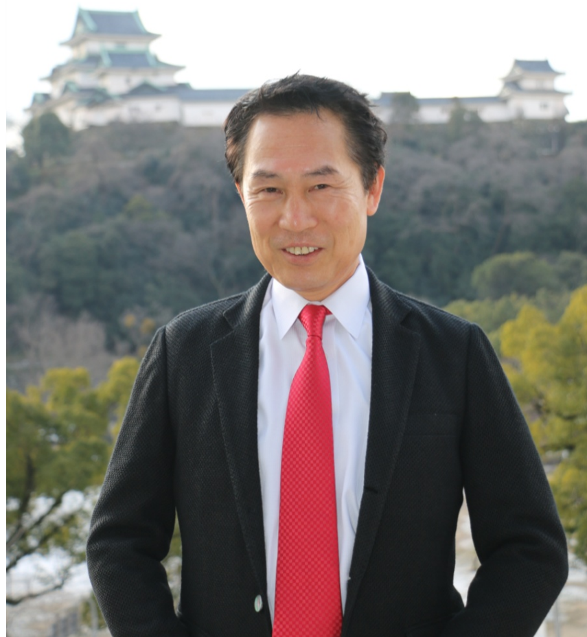
「WA Knit made in WAKAYAMA Japan」 のジャケットを着用