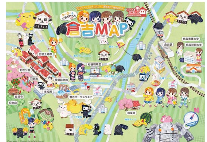
キャラクターとコラボした聖地巡礼マップ