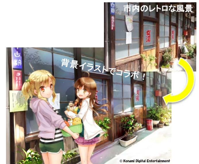
キャラクターを市内のレトロな風景と融合させた企画