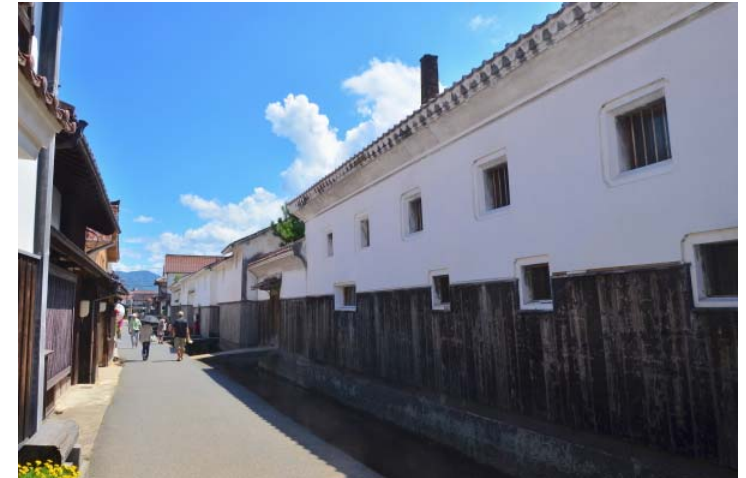
国重要伝統的建造物群保存地区に指定される歴史的まちなみ