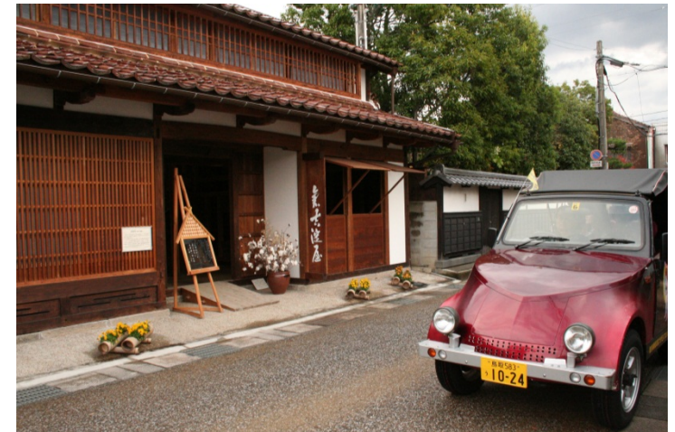
市に現存する最古の町屋建物