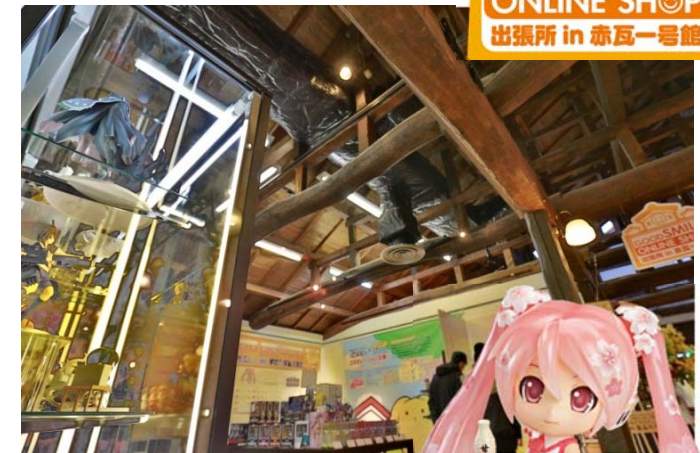
白壁土蔵群にある醤油蔵を リノベーションしたレトロなギャラリーで 開催されるフィギュアなどの展示会

©Crypton Future Media,INC. www.plapro.net piapro