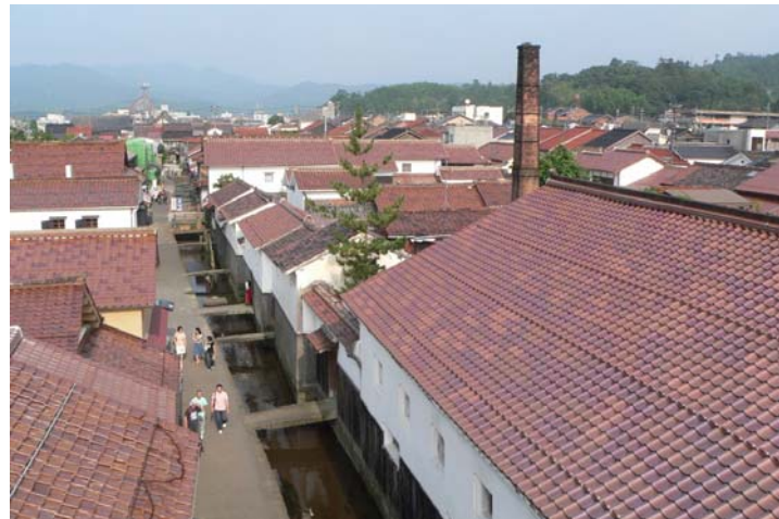
周辺には、石橋や、赤瓦に白い漆喰壁などレトロな風情が広がる