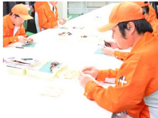
キャラクターフィギュアは、市内の工場で製造されている