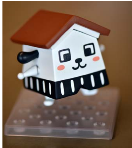
市のイメージキャラクター「くらすけくん」のフィギュア化

これらの取り組みを通じて、レトロとクールがまちなかに共存し、キャラクターグッズが生み出される唯一のまち Kurayoshi としての世界的な地位を確立することが可能となります。