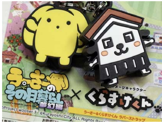
市のイメージキャラクターとコラボしたグッズ

倉吉で誕生した「 ねんどろいど 桜ミク Bloomed in Japan 」は倉吉市のふるさと納税の贈呈品としても利用されました。