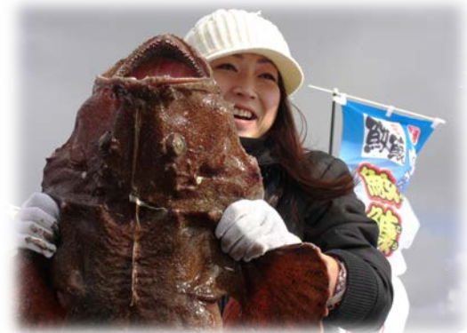
活かたまま水揚げされる「風間浦鮫鱈」