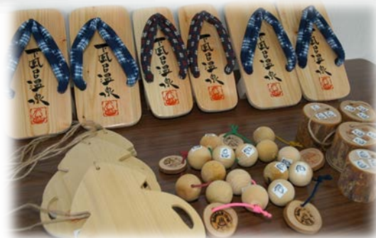
「遊(湯)めぐりグッズ」

「青森ヒバ」の魅力を発信するために、村内には青森ヒバ材を用いたペンションもあり、休日には宿泊の家族連れで木工体験が行われるなど観光客の目玉スポットとなっており、村の貴重な地域資源となっています。