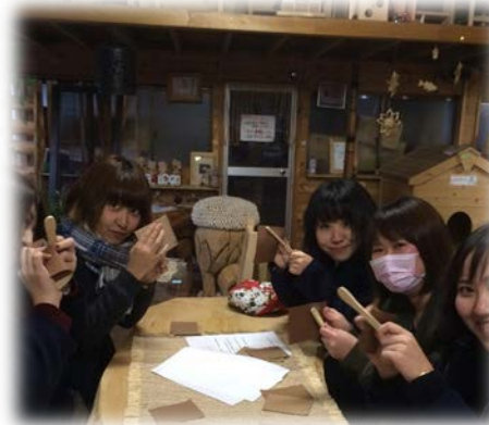
大学生による木工体験の様子