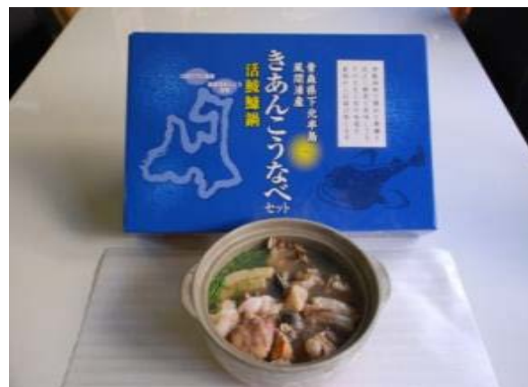
風間浦鮫鯨を用いた鮫鯨鍋セット