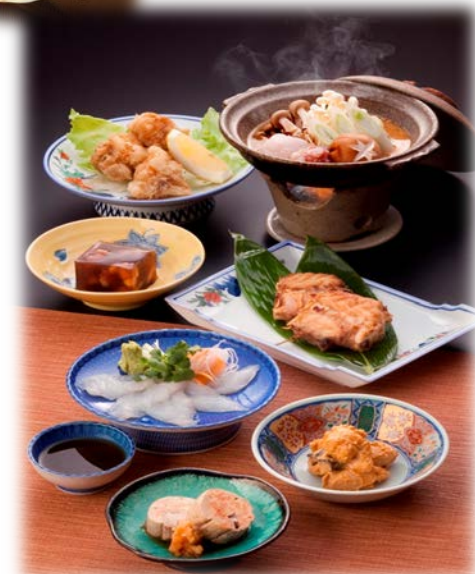
鮫鯨のフルコース料理

風間浦鮫鯨に着目した商品開発を行う企業が現れ、蓄養方法や活×処理、そして独自流通システムなど販路開拓に取り組んでいます。現在も「あん肝」の珍味商品の開発が進められており、特産品として、期待がされています。