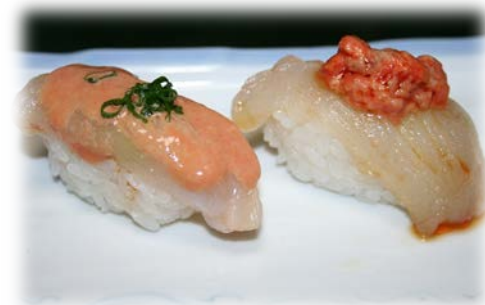
鮫鯨の鮓 (上部は、あん肝)