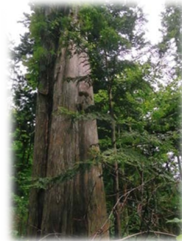
樹齢300年超の「青森ヒバ」

「青森ヒバ」で建てられた家には、蚊やシロアリなどの害虫が近寄ってこないと言われていています。シロアリに対する24時間後の致死量は1.20mgであり、非常に効果的な殺虫活性が認められています。また、蚊やゴキブリに対する忌避効果、殺虫活性も確認されています。