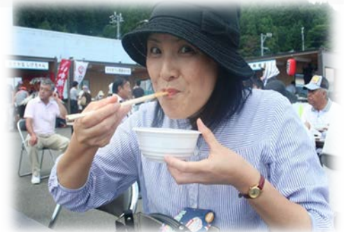
小どんぶりを食す来場者

今後も、下北ブランド開発推進協議会と連携し下北ブランド産品の知名度向上を図っていきます。