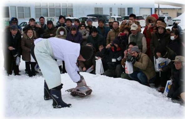
特別イベントでの鮫鯨雪中切り実演