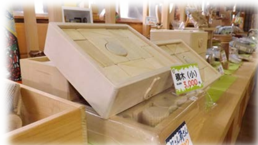
ヒバ加工品展示販売ブース