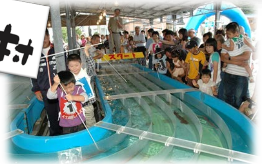
「元祖 烏賊様レース」