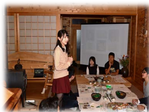
「ケアカフェかざまうら」の様子