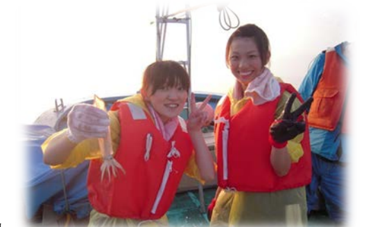
「イカ釣り海上遊覧体験」