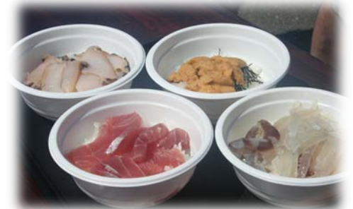
地元食材を用いた小どんぶり