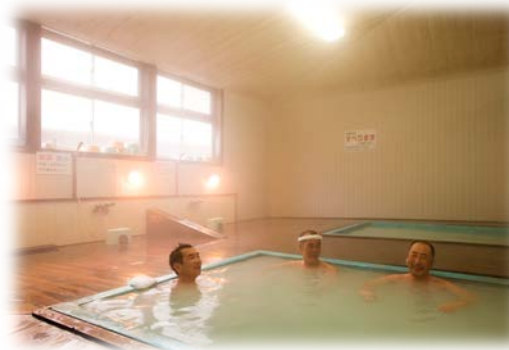
下風呂温泉郷「大湯」