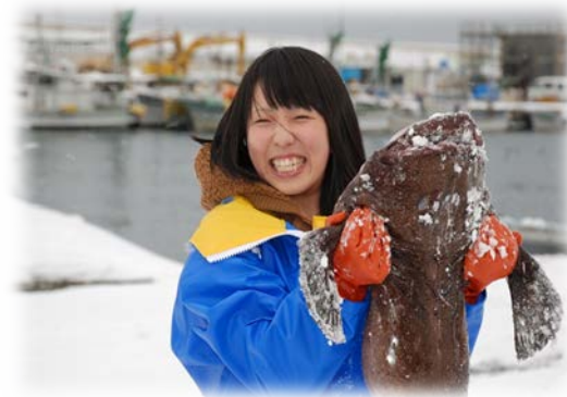
「鮫鱈獲ったど〜」と記念撮影する観光客

また、会場内の出店ブースでは、風間浦鮫鱈鍋セットや鮫鱈焼き（鮫鱈の形をしたおやき）、「青森ヒバ」木工品の販売やイカやタコ、昆布などの加工品の販売なども行われ終日にぎわっています。