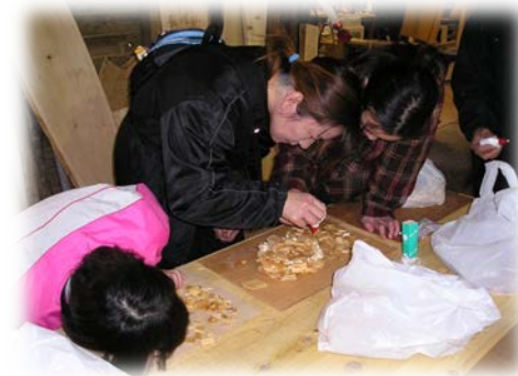
木工体験を楽しむ観光客