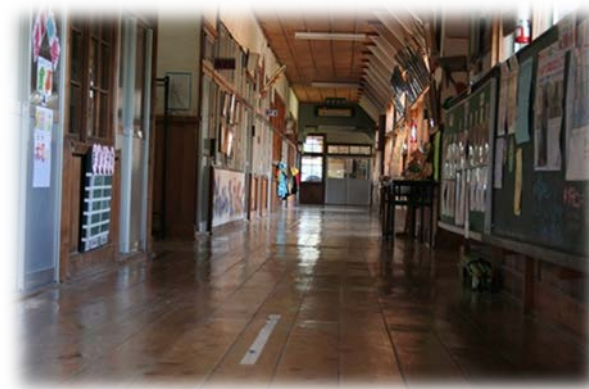
青森ヒバ材の廊下 (昭和28年築 当村内の小学校)