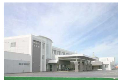
養護老人ホーム和風園