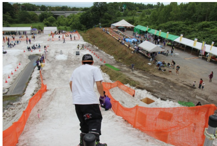
雪山センターを活用して行われた、真夏の雪イベント「雪夏祭」