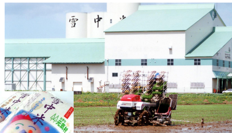
スノークールライスファクトリー（上） 雪中米（左）

「スノークールライスファクトリー」では、貯留乾燥ビンに貯蔵された2500トンの米を1500トンの雪で粳のまま貯蔵しています。これにより、真夏に新米と同等の風味を味わえる沼田のブランド米「雪中米」が誕生。全国に出荷し、現在では海外にも輸出されています。