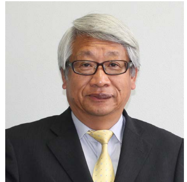
沼田町長 金平嘉則

沼田町にとって雪は大切な宝物です。夢と希望に満ちた「雪との共生」をより一層推進しながら、雪国ならではのまちづくりを町民一丸となって実現するために、『輝け雪のまち』のふるさと名物として『雪中商品』を応援してまいります。