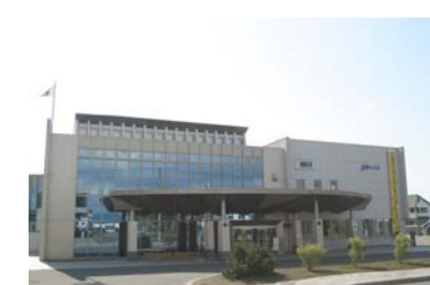
生涯学習総合センター