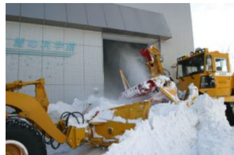
施設に雪を入れる様子