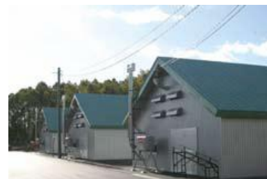
就農支援実習農場椎茸発生棟