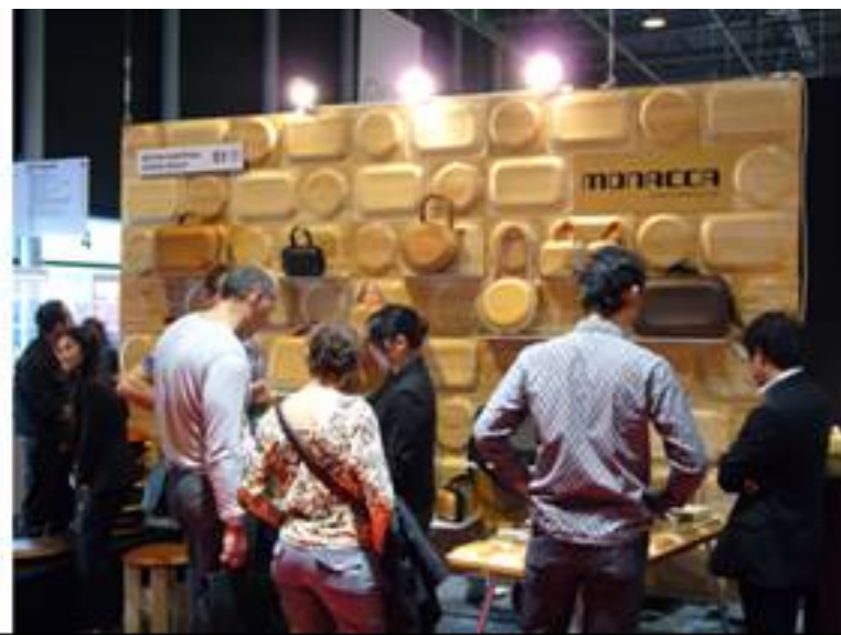
(写真上：新色のピンクおよび新型のブラック)