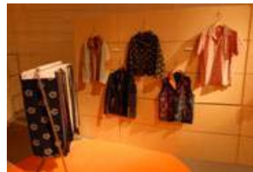
2 8 . 広川町