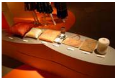
1 7 . 京都商工会議所