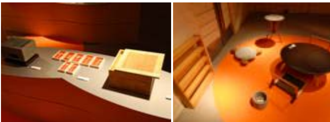
2 5 . 高松商工会議所