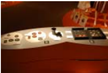
1 3 . 輪島商工会議所