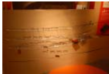
1 6 . 鯖江商工会議所