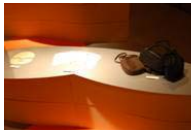
1 8 . 菟田野商工会