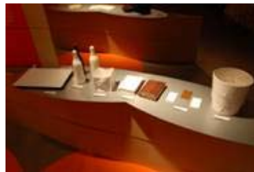
2 6 . 東かがわ市商工会