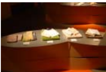
1 9 . 泉佐野商工会議所