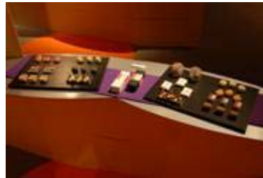
2 2 . 松江商工会議所