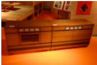
2 3 . 府中商工会議所