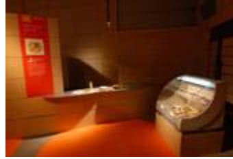
1 2 . 紀北町商工会