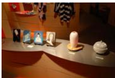
2 9 . 苓北町商工会