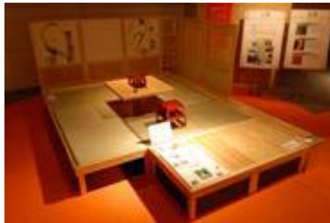
2 1 . 御坊商工会議所