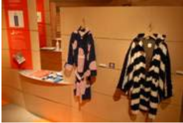
1 1 . 有松商工会