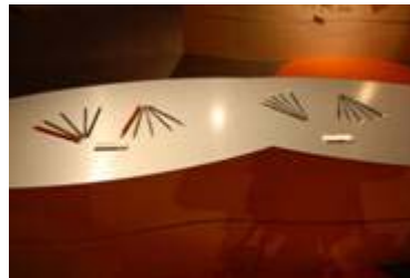
2 4 . 熊野町商工会