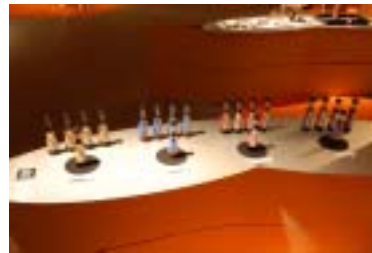
1 4 . 能登町商工会