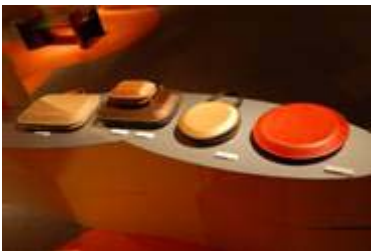
2 7 . 中芸地区商工会