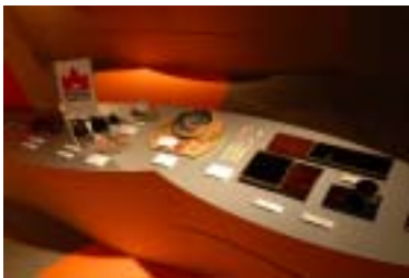
1 5 . 山中商工会