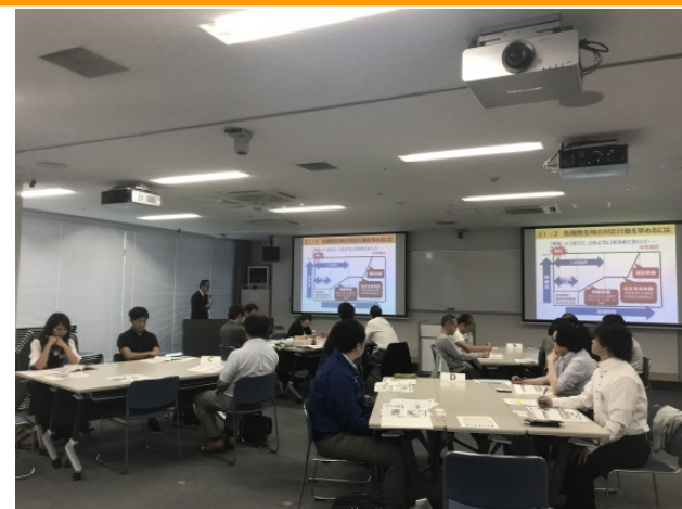
写真:セミナーの様子