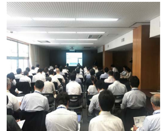
セミナー風景 （平成30年6月名古屋会場）