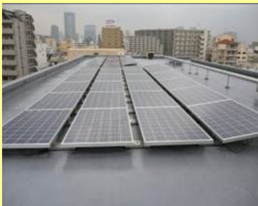
ビル屋上に設置した太陽光発電モジュール