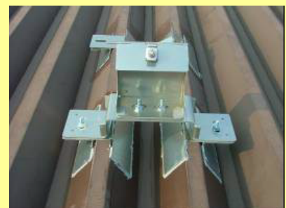
折板屋根に簡単に取付可能な金具 (屋根には接着剤で固定)