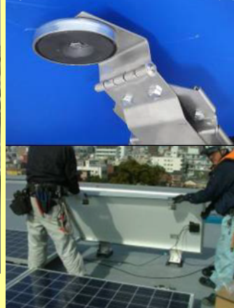
実用化した磁石式取付金具