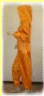
岩盤浴スーツ試作品