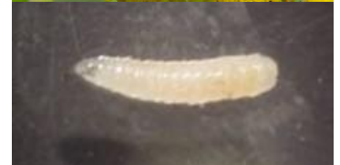
上: 糖尿病性壊疽患者の治療前と治療後の足の写真 右上: ヒロズキンバエ(成虫) 右下: 医療用無菌ウジ