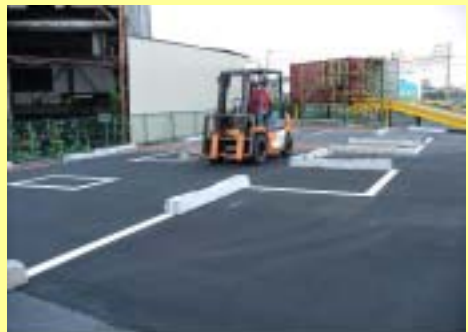
屈曲走行訓練風景