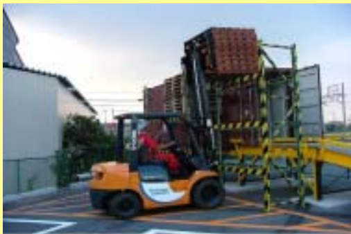
高所パレットラック訓練風景