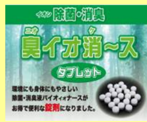
錠剤(水に溶かし使用)