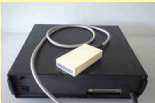
装置本体と筋変位プローブ 「アトラスケール」と表示画面(サンプル)