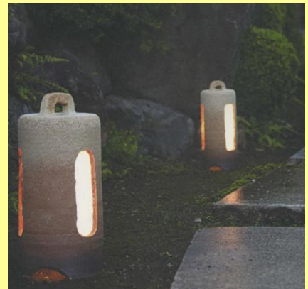
ゆらぎ照明商品例