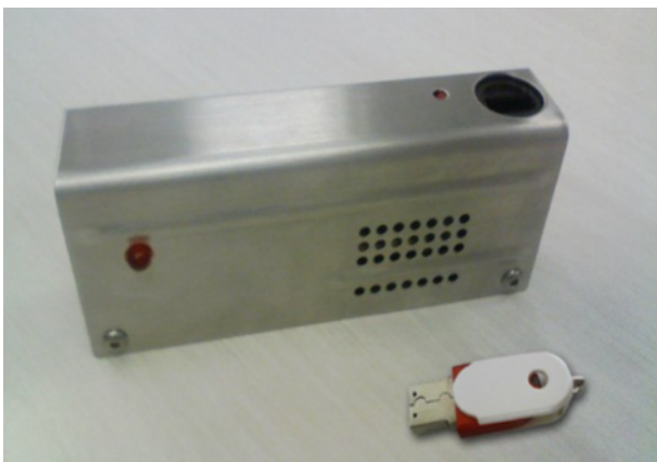
レジスター取付例