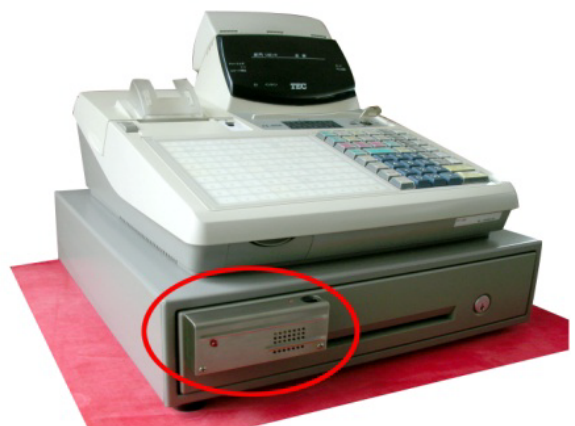
レジスター取付式現金盗難警報装置外観