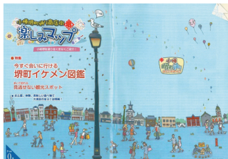
楽しみマップ・イクメン図鑑

また課題③については、組合としてのイベント「小樽堺町ゆかた風鈴まつり」「ハロウィン」「おたる雪あかりの路イベント」を充実させるとともに各団体との連携を図ったことで、小樽市民も気軽に楽しめる企画として好評で、年々来場者が増加している。